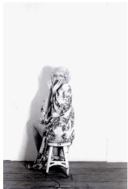
Photographe : Cindy Sherman